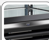
Ηλεκτρονικός θερμοστάτης με λειτουργία WI-FI